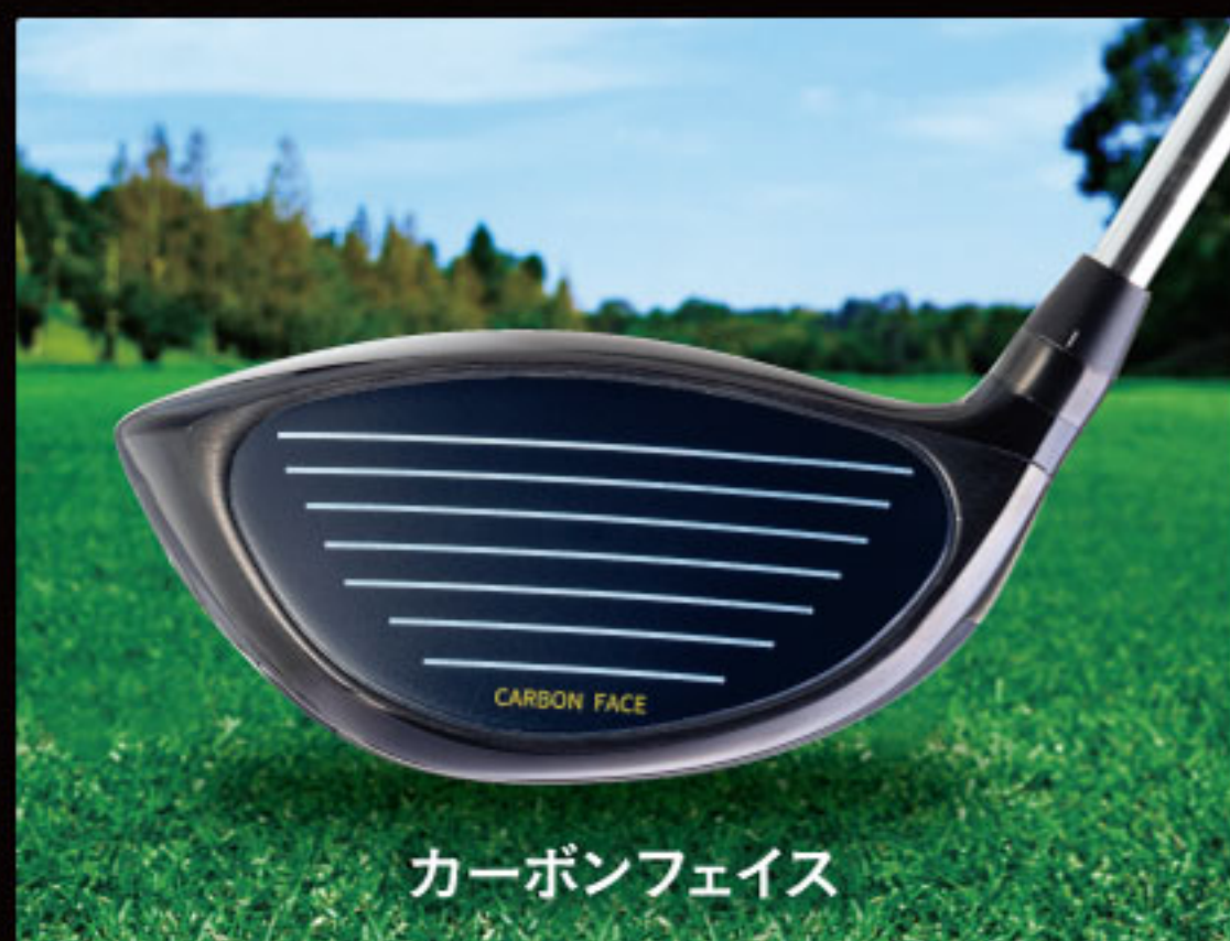
カーボンフェイス