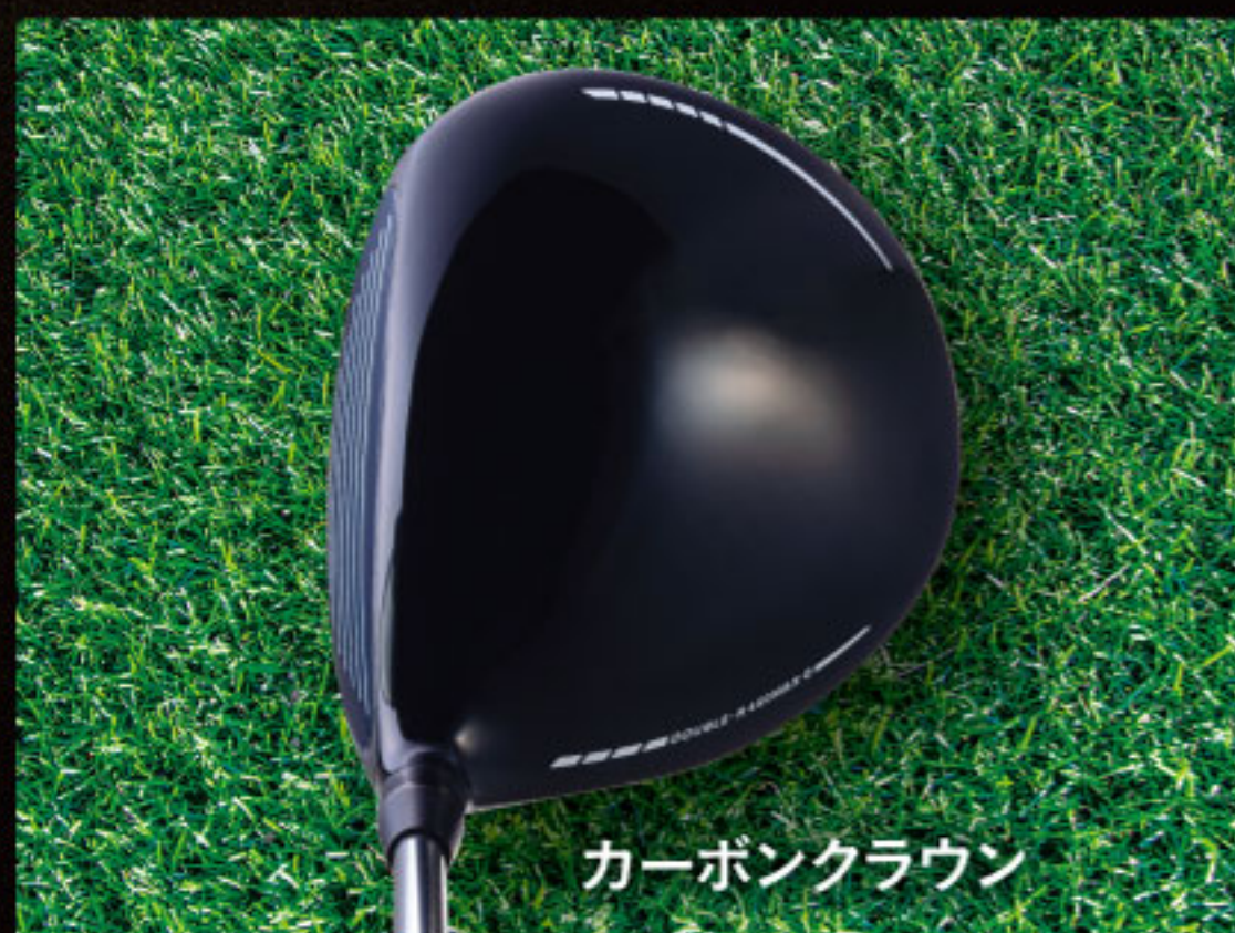
カーボンクラウン