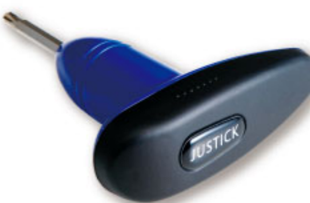
別売トルクレンチ