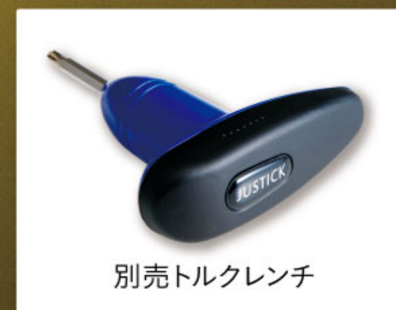
別売トルクレンチ