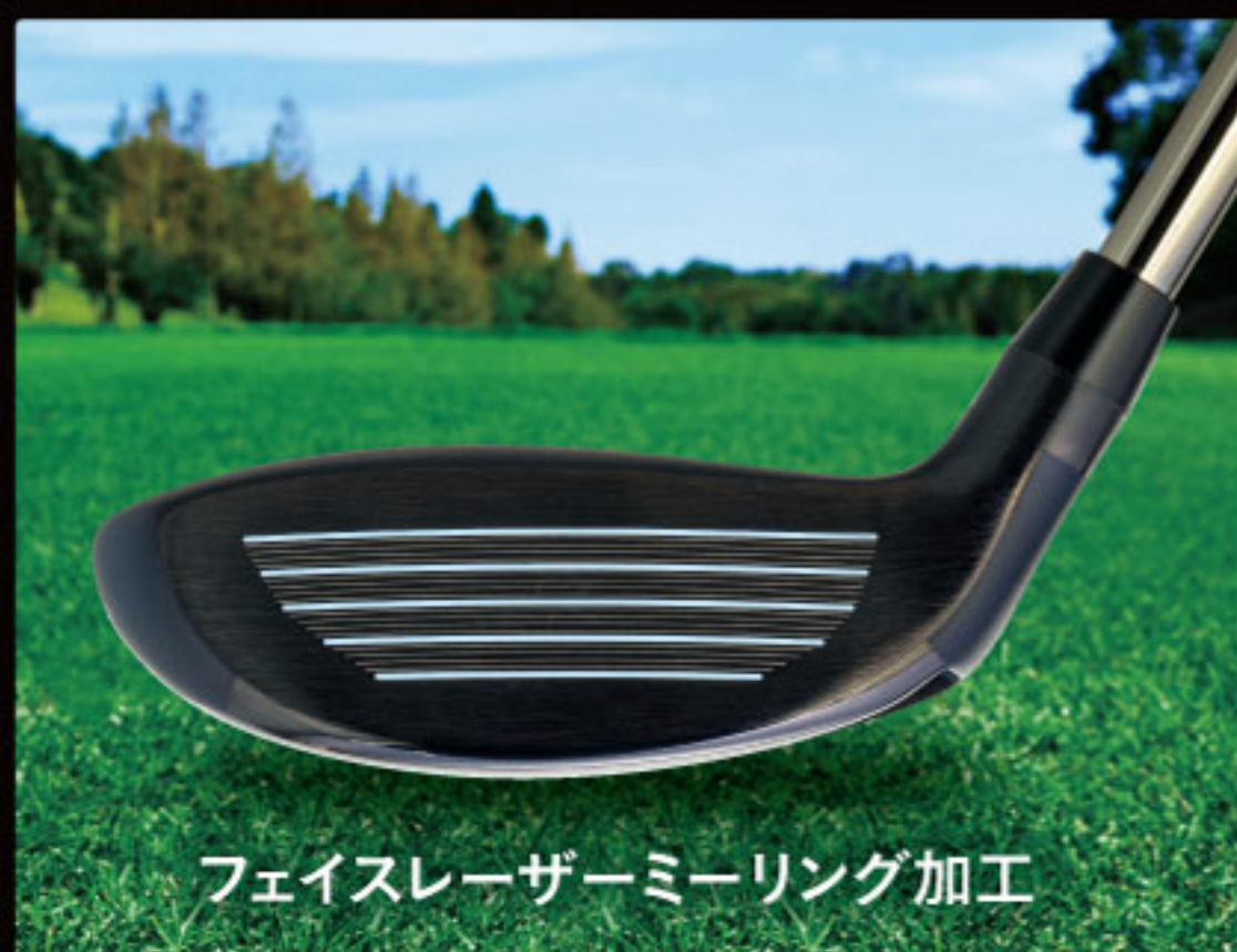
フェイスレーザーミーリング加工