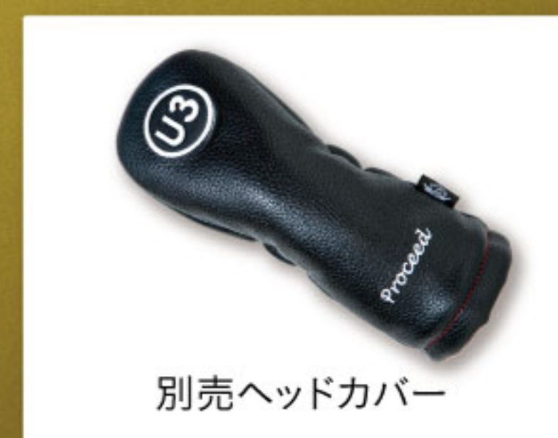
別売ヘッドカバー