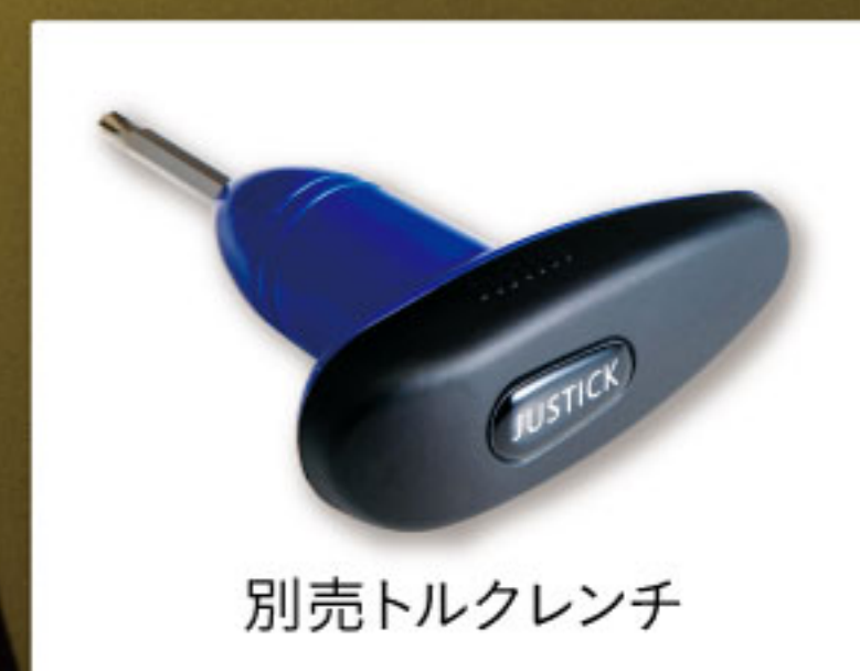
別売トルクレンチ