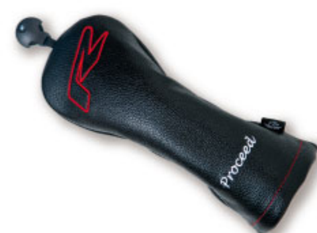
別売ヘッドカバー

※別売ヘッドカバー:定価¥5,500(税込) ※別売スリーブ:定価¥4,400(税込) ※専用トルクレンチ:定価¥4,400(税込) ※別売各ウェイト(2/4/6/8/10/12g):定価¥1,650(税込)