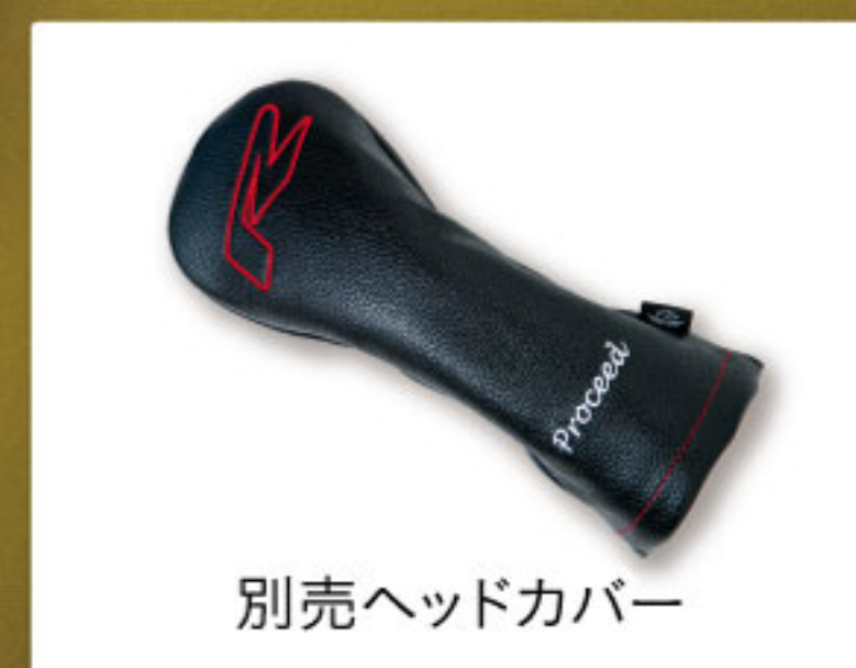
別売ヘッドカバー

※別売ヘッドカバー:定価¥5,500(税込) ※別売スリーブ:定価¥4,400(税込) ※別売トルクレンチ:定価¥4,400(税込) ※別売各ウェイト:定価¥1,650(税込) (2/4/6/8/10/12g) ※価格が予告もなく変更される場合がございます。